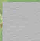
Metbrush Alu 69