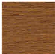
GOLDEN OAK 51

Forme clasice, arce, ferestre segmentate, asimetrice, triunghiuri, geamuri rotunde, ferestre mari, usi culisante, armonice: posibilitatile de creatie sunt nelimitate iar stabilitatea si proprietatile de izolare fonica si termica ale ferestrelor sunt certificate de numeroasele probe si teste trecute la cele mai prestigioase institute europene.