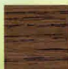
Eiche Hell 24