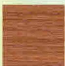
Streifen Douglasie 27