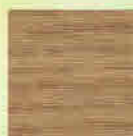
Eiche Natur 23